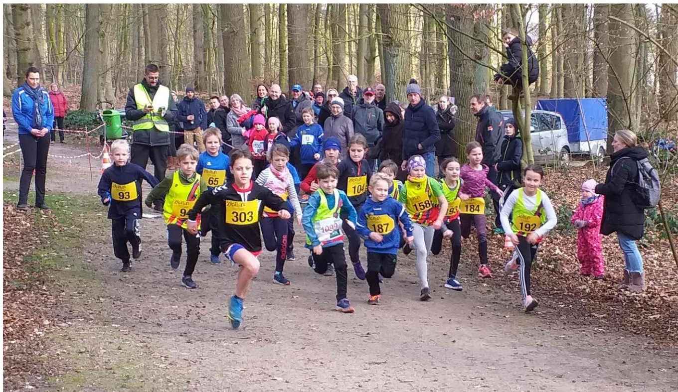
Bild: Start der Altersklassen M/W 8 und M/W 9