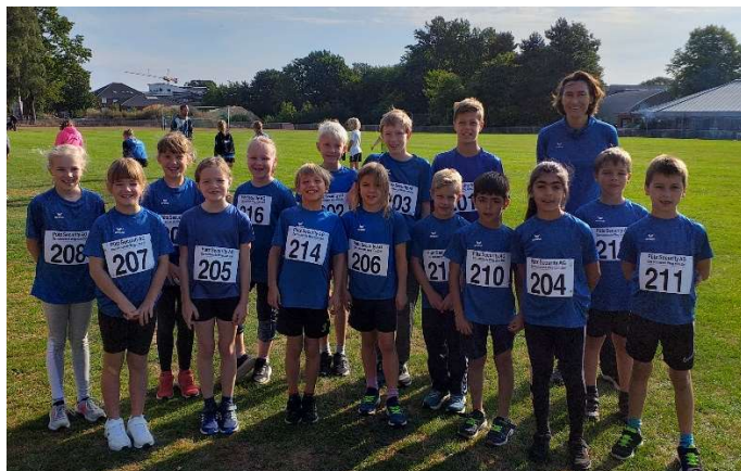
Teilnehmer Kreismeisterschaft 04.09.

Am 19.09.22 führten wir im Rahmen des Trainings unsere Vereinsmeisterschaften durch. Hin und hergerissen von der Wetterprognose entschieden wir uns am Ende, den Wettkampf durch zu führen. Bis auf ein wenig Regen und etwas weiter entferntem Gewitter ging es dann und wir hatten Glück. In anderen Ortsteilen von Bad Bramstedt gab es Hagelschauer.